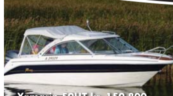
Yamarin 59HT kr. 159.800,-