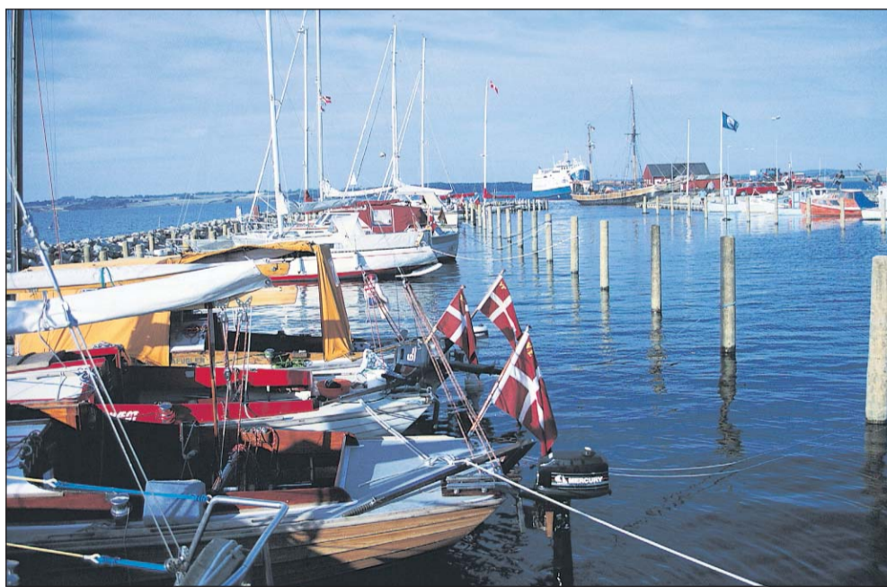
Lyø Havn med færgen i baggrunden. Mere idyllisk kan det vel næppe blive, men sådan ser der ifølge bogen ud på mange øer, selv om der er stor forskel på idyllen.