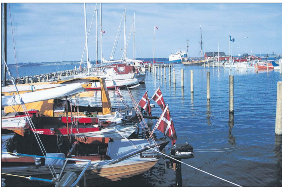
Lyø Havn med færgen i baggrunden. Mere idyllisk kan det vel næppe blive, men sådan ser der ifølge bogen ud på mange øer, selv om der er stor forskel på idyllen.