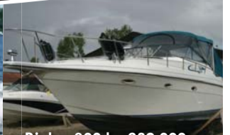
Rinker 300 kr. 289.000,-