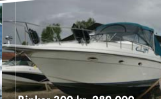
Rinker 300 kr. 289.000,-