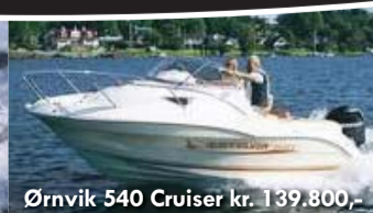
Ørnvik 540 Cruiser kr. 139.800,-