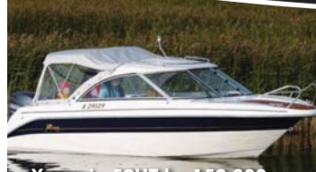
Yamarin 59HT kr. 159.800,-