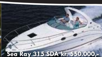
Sea Ray 315 SDA kr. 550.000,-